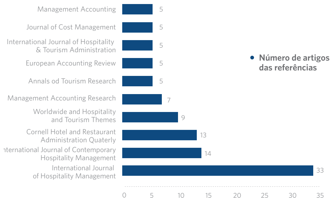
FIGURA 2: RELAÇÃO DOS PERIÓDICOS EM DESTAQUE NAS REFERÊNCIAS

Em seguida, obteve-se a avaliação dos periódicos das referências por meio da análise de 423 referências nos artigos selecionados, que estão disseminadas em 79 periódicos diferentes. Na Figura 2, observam-se os dez periódicos que mais se destacam.