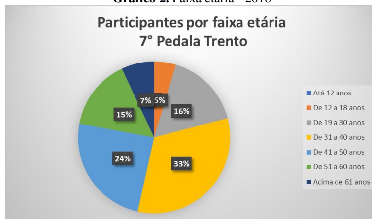
Gráfico 2. Faixa etária - 2018

Houve uma mudança na faixa etária da edição em 2018, ao fazer o comparativo com a primeira, com a maioria dos participantes na faixa dos 31 aos 50 anos, com presença significativa nas faixas etárias acima, como, por exemplo, a presença de seis cicloturistas com mais de 61 anos. Como são sujeitos com independência financeira e relações sociais estabelecidas, os grupos formados para participar desses roteiros é um elemento significativo a ser explorado em outras propostas de circuito para cicloturistas, bem como tema de pesquisas futuras.